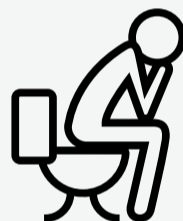
Orina oscura y heces blanquecina

Ante cualquiera de estos síntomas consultá inmediatamente al personal médico.