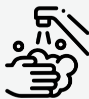
Lavate las manos con agua y jabón (luego de ir al baño, antes de comer o de cocinar)