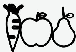
Lavá bien frutas y verduras antes de comerlas.