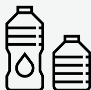
Tomá agua potable