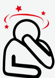
Náuseas y vómitos