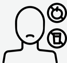
Pérdida de apetito