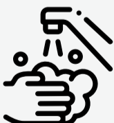
Lávate frecuentemente las manos con agua y jabón