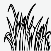
Ordená y dezmalezá para que el roedor no haga nido