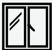
Tapá agujeros en puertas, paredes, ventanas y cañerías