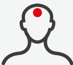
Fiebre, dolor de cabeza, muscular y de articulaciones