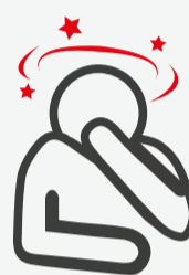
Náuseas y vómitos