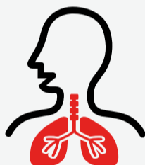
Dificultad para respirar

Ante cualquiera de estos síntomas consultá inmediatamente al personal médico.